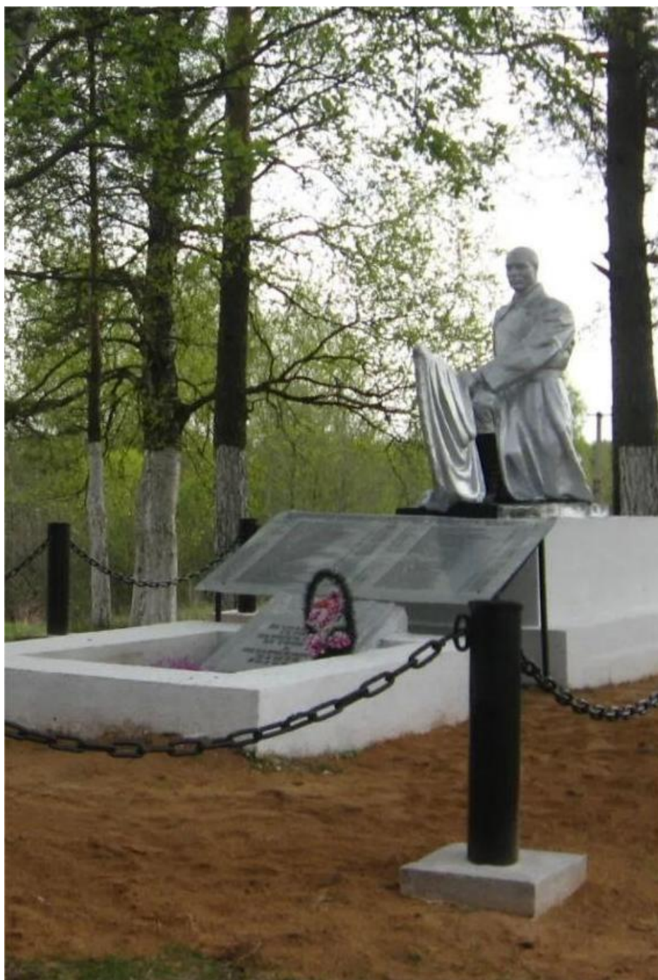
Памятник-обелиск над Братской могилой, где похоронен мой дед.